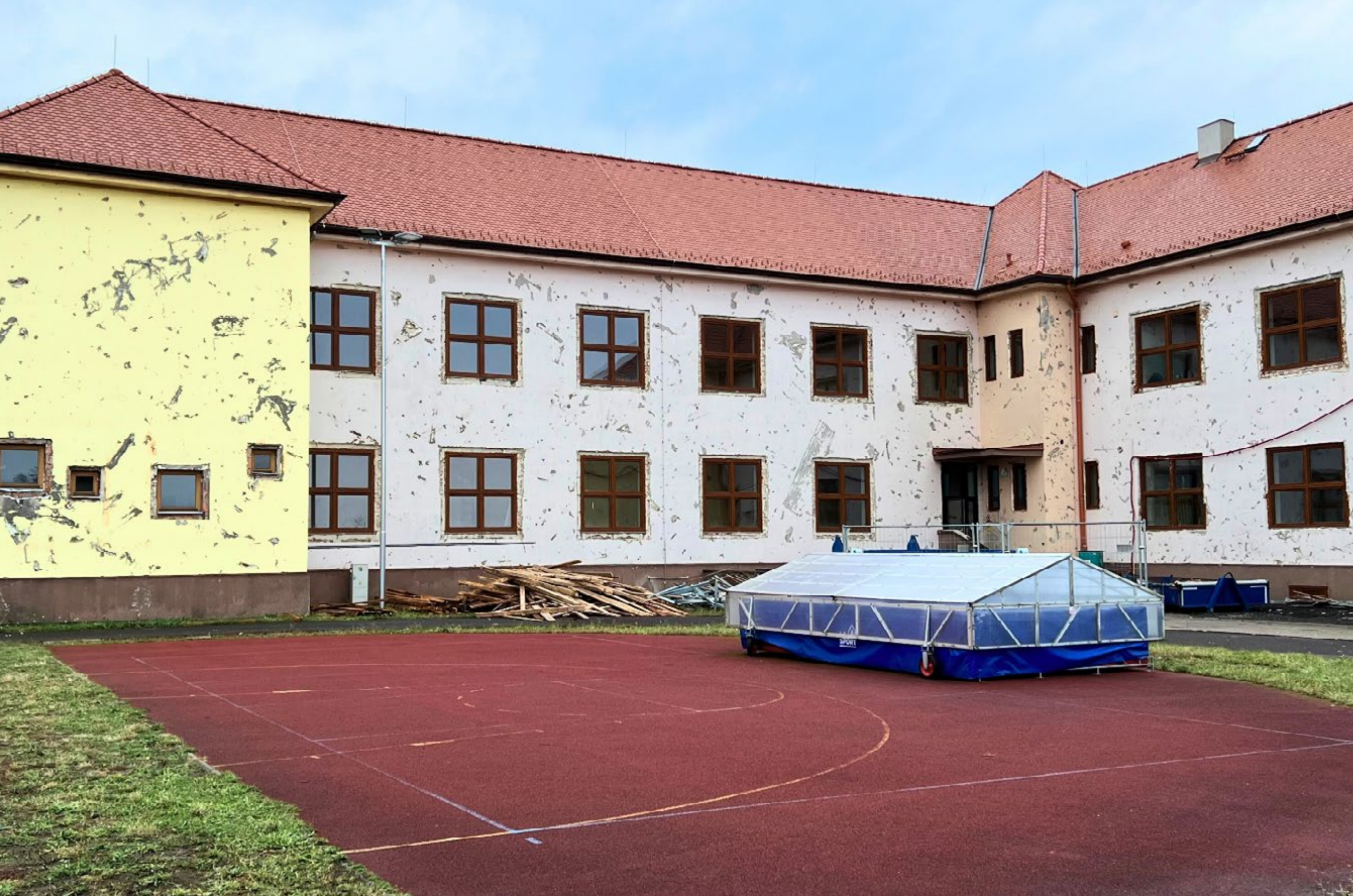
Poničená fasáda budovy, kterou poškodilo tornádo v roce 2021.